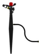
Montage avec pic P10