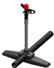
Montage avec CPEC semelle