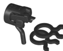
Kit Secteur 12 Système breveté