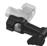
Kit brise jet BJ12